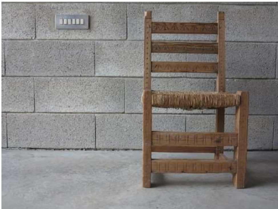
PHOTOMATH 2017, 1º Premio_ categoría A